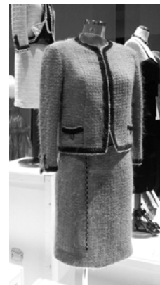
Imagen 2 en wikipedia.org bajo licencia CC BY-SA 4.0