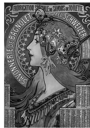
Imagen 4 en Wikipedia bajo dominio público