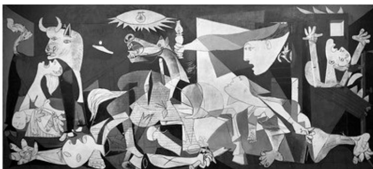
Imagén 2 en Flickr bajo licencia CC

Para elaborar tu escrito, sigue el guion propuesto: