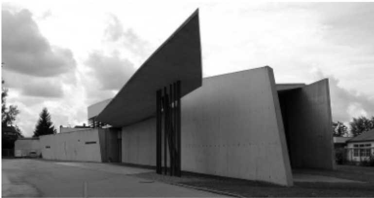
Imagen 1 en Sandsteinen