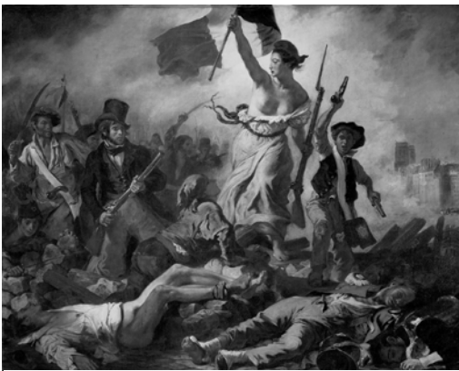
Imagen 3 en Wikipedia bajo dominio público